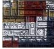
(cliquer pour agrandir) Constructive composition