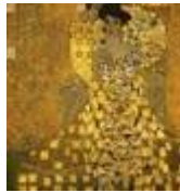
(cliquer pour agrandir) Adèle Bloch Bauer