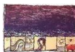
(cliquer pour agrandir) Grain