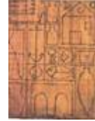
Composition à l'amphore