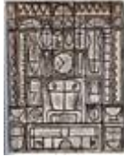
(cliquer pour agrandir) Composition