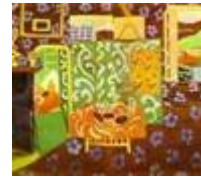
(cliquer pour agrandir) Matisse