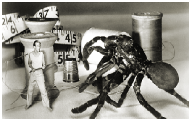
Photogramme extrait de L'homme qui rétrécit, Jack Arnold