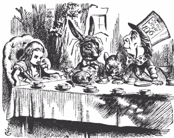
Illustration de la 1 ère édition d'Alice (1865) par John Tenniel

* Rechercher et comparer « votre Alice » et celle de différents illustrateurs, cinéastes.