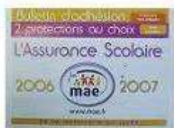
Attestation d'assurance scolaire