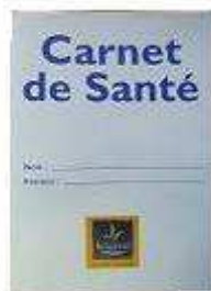
Carnet de santé