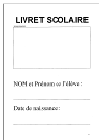
Livret de suivi

Avis d'information CAF pour le calcul du quotient familial